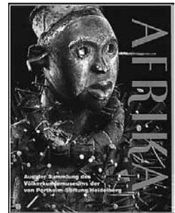
Titelbild des Ausstellungskatalogs: „Afrika. Aus der Sammlung des Völkerkundemuseums der von Portheim-Stiftung Heidelberg“. Edition Schulze-Weiss, Heidelberg 2010.

Die Arbeitsgemeinschaft Ethnomedizin führte im Jahre 2003 nach 10 Jahren wieder eine Tagung durch, ihre 16. Fachkonferenz Ethnomedizin. 2006, 2009 und 2010 fanden weitere der nunmehr jährlichen Tagungen im Museum statt.