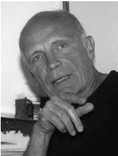
Potsdam 2009