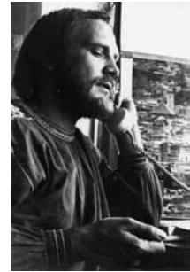
Heidelberg ITHÖG EH-Kurs 1977