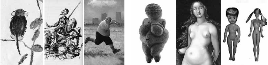
Abb. 2 und Abb. 3: 5