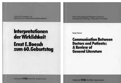
Beide im Vlg. ssip-Schriften, Saarbrücken 1977